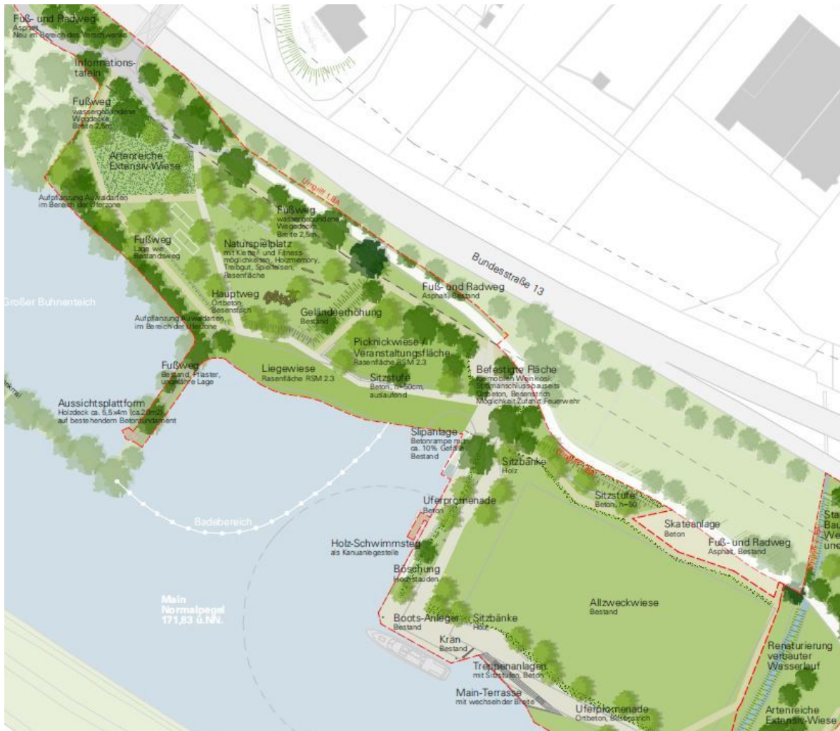
Lageplan - Quelle: https://www.eibelstadt.de/buerger/staedtebaufoerderung/mainlaende-ba-i/